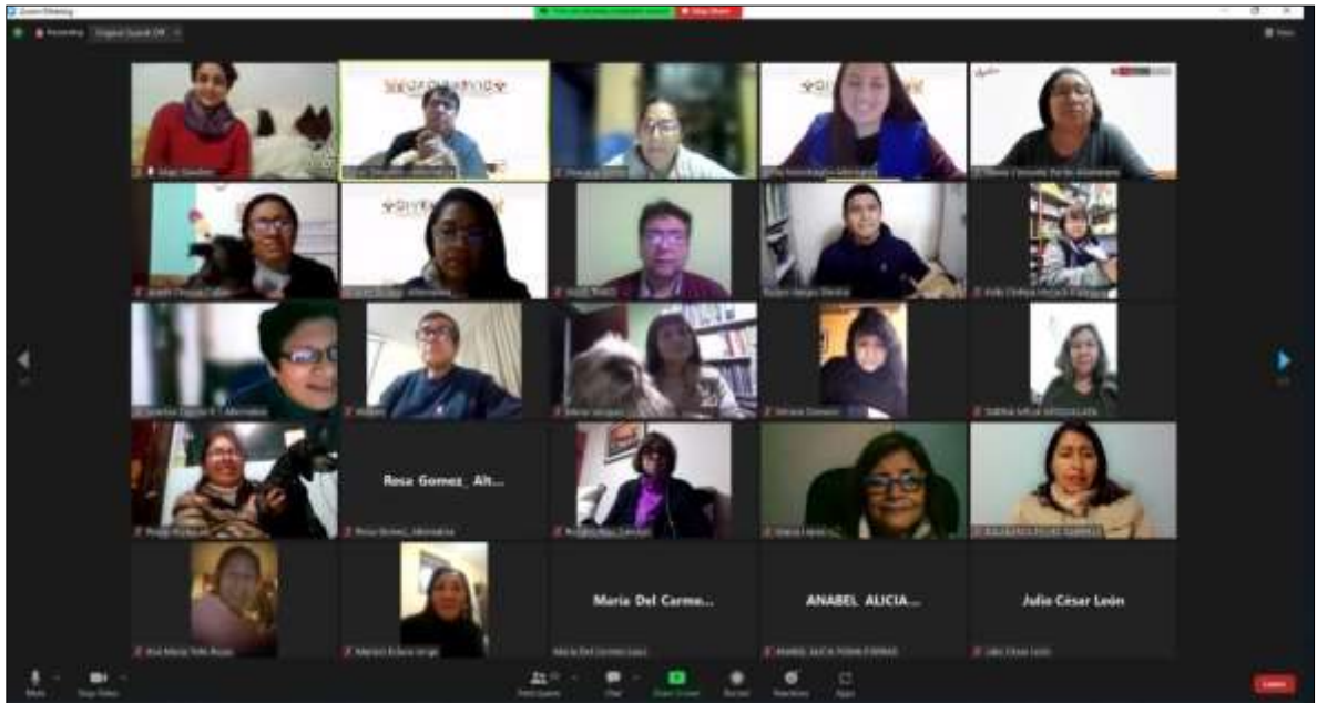
Foto N° 5 Talleres virtuales y presenciales con docentes sobre ESI