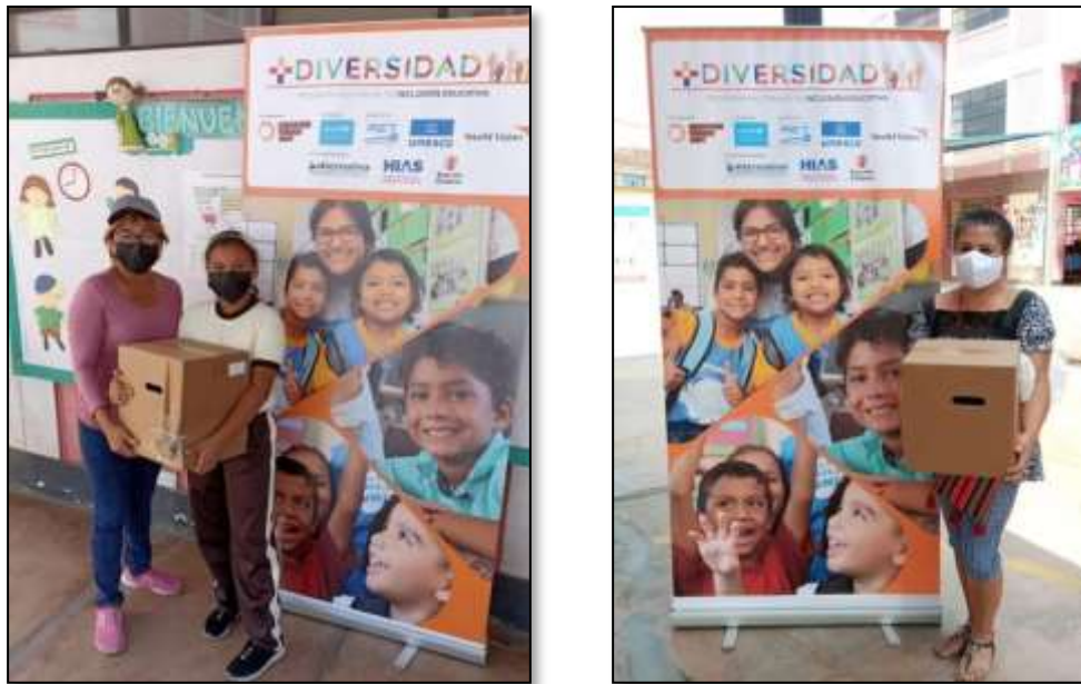
Foto N° 3 Entrega de Kits en Instituciones Educativas

Resumen de N° de estudiantes beneficiarios de Kits, Celulares y Bonos – Abril 2022 según IIEE