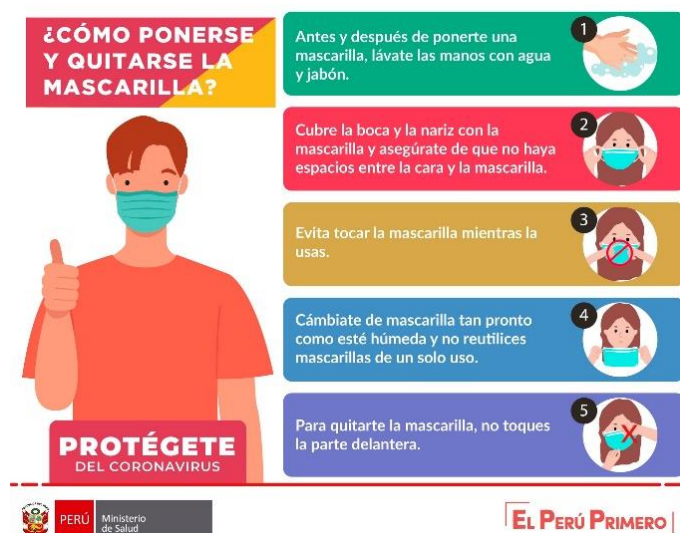
Figura 2. Uso correcto de la mascarilla